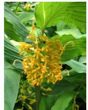
ช่อห้อยทรงกระบอกสีเหลือง