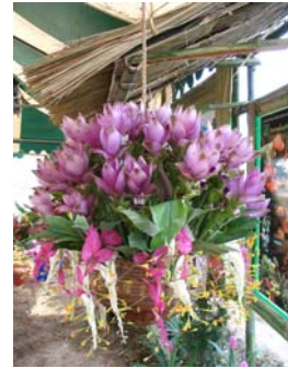
การใช้ดอกหงส์เห็นร่วมกับดอกไม้อื่นๆ