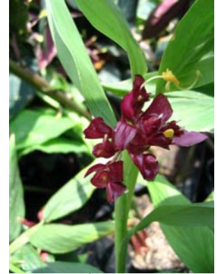
ช่อดังสีแดงเข้ม