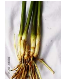
ลำต้นเทียม