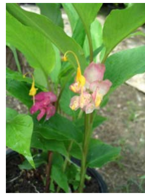
ดอกจริง(สีเหลือง)