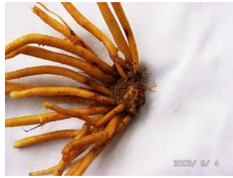
รากสะสมอาหาร