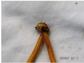
หัวพันธุ์หงส์เหิน

ดอก ดอกจริงมีสีเหลืองลักษณะของดอกคล้ายกับหงส์กำลังบิน และมีกลีบประดับ(bract)ที่มีรูปทรงและสีที่หลากหลาย การออกดอกจะออกดอกเมื่อมีใบประมาณ 5 ใบ