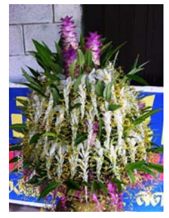
การใช้ประโยชน์