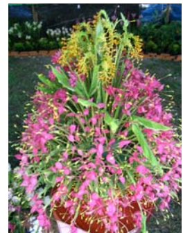
นิทรรศการดอกเข้าพรรษา(หงส์เหิน) จ.สระบุรี ปี 2547