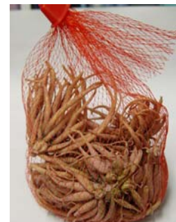
ลักษณะกลุ่มหัวพันธุ์ (1 กลุ่ม มี 3-5 หัว)