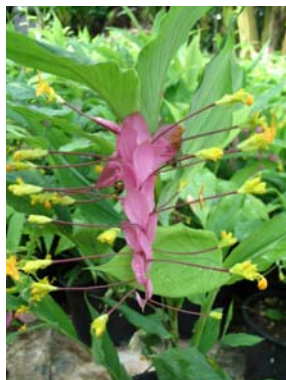
ช่อห้อยสีชมพู