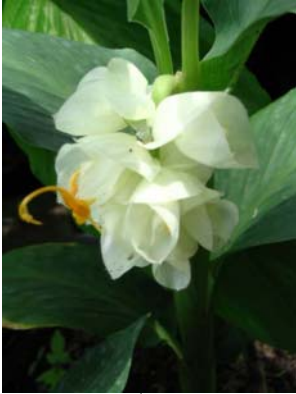
ช่อดังสีขาว