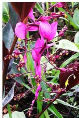
ช่อห้อยสีม่วงเข้ม