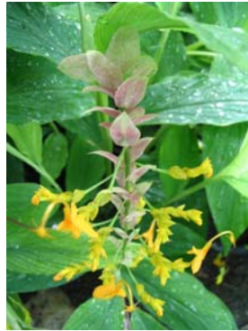
ไม่เหมาะสม