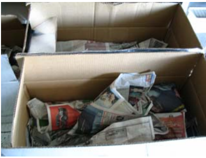
บรรจุลงกล่อง