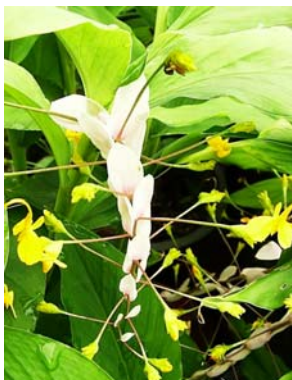
ช่อห้อยสีขาว