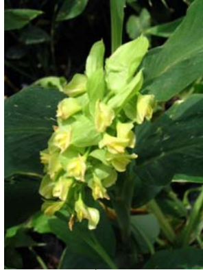
ช่อดังสีเขียว