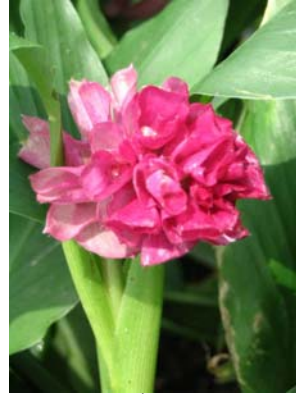
ช่อดังสีชมพู