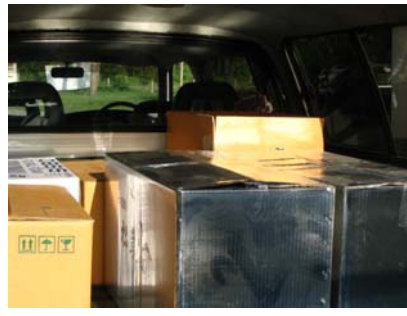
การขนส่ง