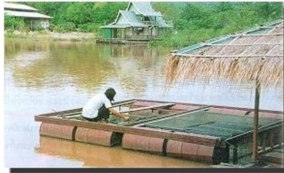
ทุ่นลอยที่ช่วยพยุงให้กระชังลอยน้ำได้ จะใช้แพลูกบวบ หรือถังน้ำมัน ปลาแรดสามารถเลี้ยงเป็นปลาเนื้อ และปลาสวยงาม