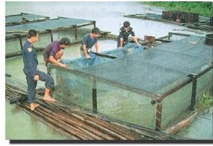
กระชังเลี้ยงปลาแรด ตัวกระชังใช้วัสดุจำพวก ไนลอนหรือโพลีเอทิลีน