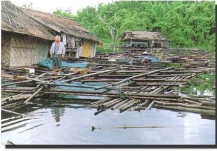
กระชังเลี้ยงปลาแรด ซึ่งใช้ไม้ไผ่เป็นวัสดุ