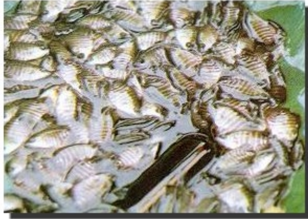
ลูกปลาแรดขนาดประมาณ 3 นิ้ว ซึ่งนำไปเลี้ยงเป็นปลาขนาดโต และปลาสวยงาม ราคาตัวละ 3-4 บาท

แหล่งพันธุ์ปลาแรด เนื่องจากการเพาะพันธุ์เพื่อจำหน่ายลูกยังมีไม่มาก ส่วนใหญ่จะรวบรวมลูกปลาจากธรรมชาติ