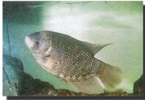
ปลาแรดสามารถเลี้ยงเป็นปลาสวยงาม หรือเป็นอาหาร ซึ่งตลาดผู้บริโภคต้องการน้ำหนักประมาณ 1 กิโลกรัม

ปลาแรด (Giant Gouramy) Osphronemus goramy (Lacepede) เป็นปลาน้ำจืด ขนาดใหญ่ของไทยชนิดหนึ่ง ปลาขนาดใหญ่ที่พบมีน้ำหนัก 6-7 กิโลกรัม ความยาว 65 เซนติเมตร เป็นปลาจำพวกเดียวกับปลากระดี่และปลาสลิดแต่มีขนาดใหญ่กว่ามาก มีเนื้อแน่นนุ่ม เนื้อมากไม่ค่อยมีก้างรสชาติดี จึงได้รับความนิยมจากประชาชนผู้บริโภค ทั้งในประเทศและต่างประเทศ สามารถนำมาประกอบอาหารได้หลายชนิด เช่น ทอด เจียน ต้มยำ แกงเผ็ด ลาบปลา และน้ำยา ฯลฯ ในระยะหลังได้รับการจัดเป็นปลาจานในภัตตาคารต่าง ๆ หรือจะนำมาเลี้ยงเป็นปลาสวยงามก็ได้ สำหรับผู้เลี้ยง ปลาแรดเป็นปลาที่เลี้ยงง่ายเช่นเดียวกับปลาสลิดราคาค่อนข้างสูง มีความอดทนต่อสภาพแวดล้อมและโรคได้เป็นอย่างดี ให้ผลตอบแทนต่อการลงทุนดีมีกำไรและไม่มีปัญหาเรื่องตลาดเป็นปลาที่เลี้ยงได้เป็นอย่างดีทั้งในบ่อและกระชัง มีอัตราการเจริญเติบโตรวดเร็ว สามารถแพร่ขยายพันธุ์ในบ่อได้ โดยเลี้ยงเพื่อขาย เป็นปลาเนื้อหรือปลาสวยงาม