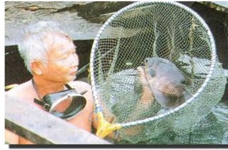
ผลผลิตปลาแรดที่เลี้ยงในกระชัง ที่อำเภอทองผาภูมิ จังหวัดกาญจนบุรี