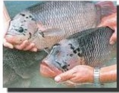
พ่อแม่พันธุ์ปลาแรดที่สมบูรณ์เพศ พร้อมที่จะผสมพันธุ์

2. การเพาะพันธุ์ปลา ปลาแรดสามารถวางไข่ได้ตลอดปี แต่จะมีไข่สูงใน ช่วง 7 เดือน ตั้งแต่เดือนกุมภาพันธ์-สิงหาคม ปลาแรดจะสร้างรังวางไข่การเพาะพันธุ์ จึงควรใส่ฟางหรือหญ้าเพื่อให้ปลาแรดนำไปใช้ในการสร้างรัง รังจะมีลักษณะคล้ายรังนกและจะมีฝาปิดรัง ขนาดรังโดยทั่วไปมีเส้นผ่าศูนย์กลางยาว 1 ฟุต ใช้เวลาสร้าง ประมาณ 1 สัปดาห์ การเพาะพันธุ์โดยวิธีธรรมชาติในบ่อดิน บ่อเพาะพันธุ์ควรเป็น บ่อขนาดใหญ่ 1-2 ไร่ อัตราการปล่อยปลาตัวผู้ต่อตัวเมีย 1:2 จำนวน 100-150 คู่/ไร่ แม่ปลาขนาด 3 กิโลกรัมจะมีไข่ระหว่าง 2,000-4,000 ฟอง